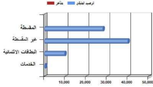
توزيع اجمالي المبالغ المتبقية